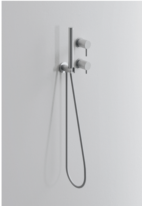
Flow D01 for shower